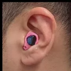
耳あな型のイメージ