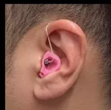
耳かけ型のイメージ

耳型採取から加工まで 約30分ほどかかります。 オーダーメイドの装着感を 体験していただけます。 (試聴はSILKかRICを選べます。)